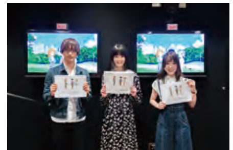
無事アフレコを終え、笑顔の出演者3人です