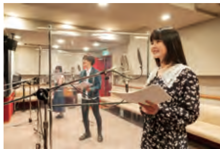
感染対策を徹底し、終始和やかな雰囲気 アフレコは進みました