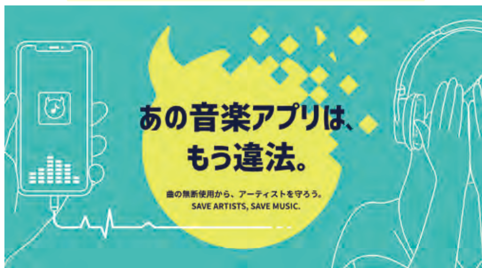
メインビジュアル

※調査に関する情報は、本誌9・10月合併号特集または当協会オフィシャルサイトプレスリリースページを参照。