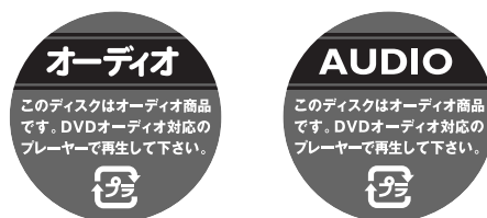
図-2 識別表示仕様DVD ビデオ共通ステッカ