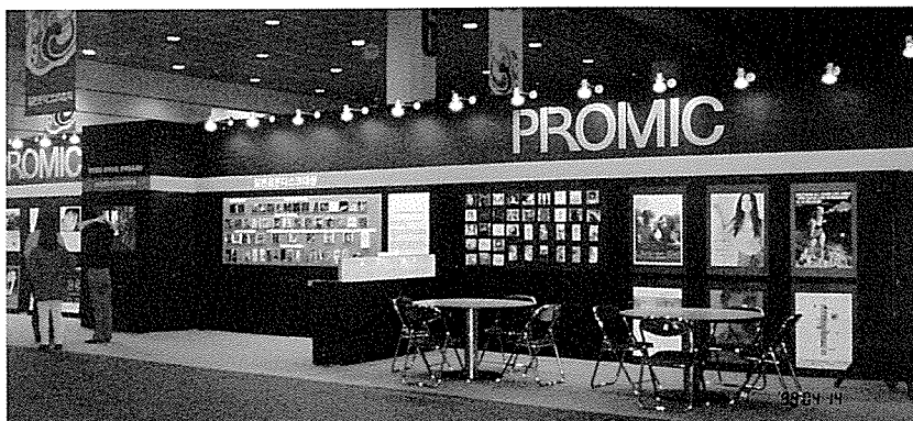
(音楽産業・文化振興財団が開設した博覧会内ブース)

日本の文化が完全に開放された暁には、少なくとも音楽産業界は韓国と日本の関係が、現在の「近くて遠